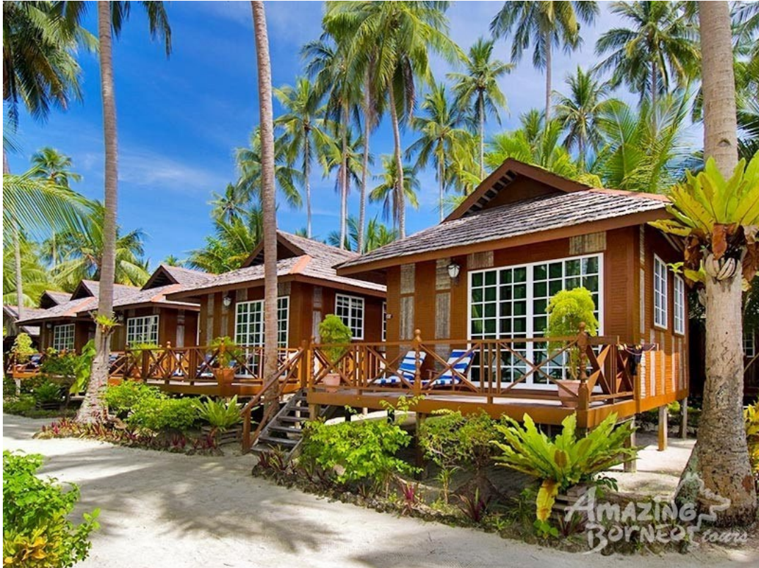
Marina di Mabul è celebre a livello mondiale come una L'isola di Mabul è rinomata in tutto il mondo come una delle migliori destinazioni per la "muck diving" e la fotografia macro.